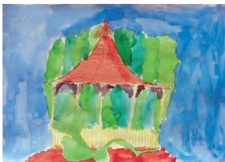
2. Sabina Baranová, ZŠ Šalounova, 2. A