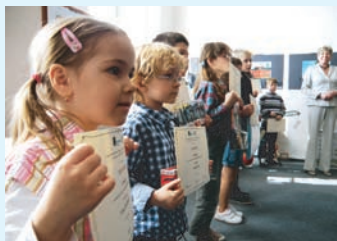
Vítězové jednotlivých kategorií.

Výtvarná soutěž O cenu starosty městského obvodu Vítkovice 2012 se uskutečňuje vždy po dvou letech od roku 1996. Soutěž je věnována dětem, které chodí ve Vítkovicích do mateřských a základních škol, a je organizována Komisí pro školství, kulturu, tělovýchovu a mládež při Radě městského obvodu Vítkovice ve spolupráci se ZŠ Šalounova 56.