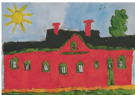
2. Tomáš Dinaj, MŠ Prokopa Velikého