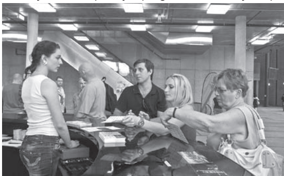
Premiéra zrekonstruovaného plynojemu.