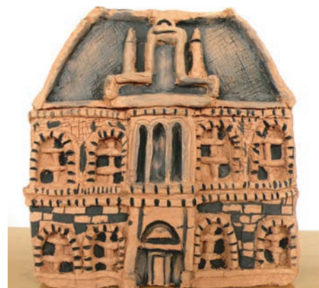
3. Kristýna Mirgová, ZŠ Šalounova, 7. třída