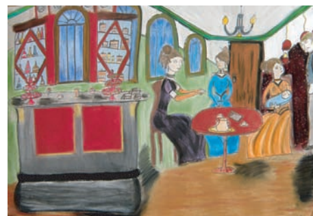
2. Dominika Janalíková, ZŠ Šalounova, 8. třída