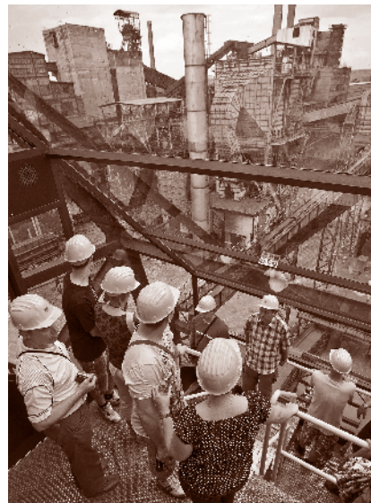
Pohled z vysoké pece č. 1.